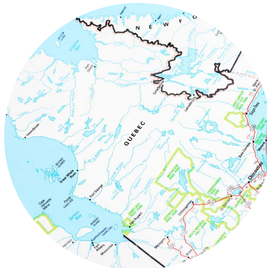
Partout au Québec

Directrice - Opérations et développement