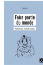
Faire partie du monde : réflexions écoféministes Collectif

Dix textes qui abordent les grands projets d'exploitation des ressources, les luttes territoriales, les droits des animaux, la crise de la reproduction, le retour à la terre, la financiarisation du vivant. Des réflexions écoféministes pour freiner la destruction du monde.