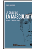
La crise de la masculinité : autopsie d'un mythe tenace