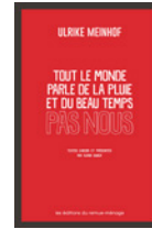
Tout le monde parle de la pluie et du beau temps. Pas nous