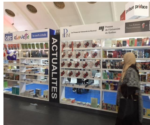
Signalisation de quelques maisons (vue de l'extérieur du stand) SIEL de Casablanca.