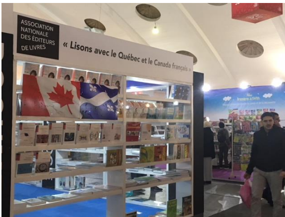
Stand ANEL-CDPL-Librairie Préface (vue de l'extérieur du stand) SIEL de Casablanca 2018.

Le stand a connu un grand succès en matière d'achalandage et de ventes. Avec l'équipe de CDPL et celle de la Librairie Préface, la responsable a eu de bonnes séances de travail, les trois parties étant très motivées à renforcer et élargir les collaborations.