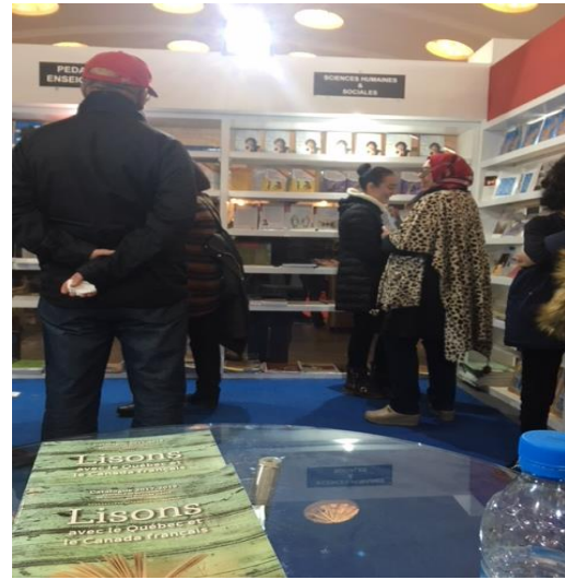
SIEL de Casablanca 2018